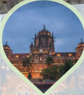
ชม Victoria Terminus สถานีรถไฟประวัติศาสตร์และเป็น มรดกโลกของยูเนสโก