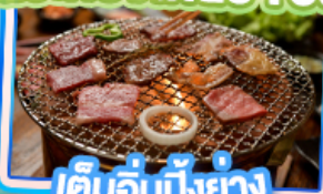
เต็มอิ่มปิ้งย่าง Yakiniku Buffet