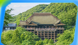
วัดน้ำใสคิโยมิสุคุระ