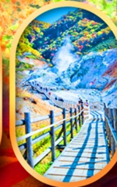
หุบเขานรกจิกุคคาบิ