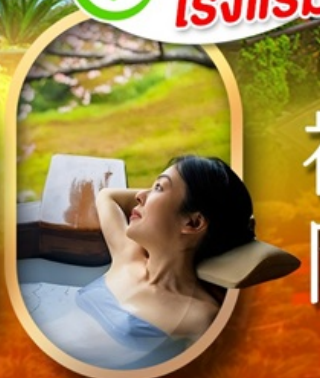
แช่ม่ออนเซ็นญี่ปุ่น