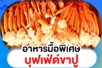
อาหารมือพิเศษ บุฟเฟ่ต์จางุ