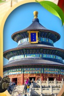
หอสังเกตการณ์เทียนถาน