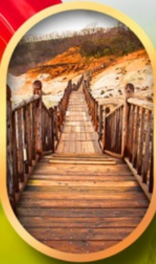
หุบเขาจิกอกุคาบิ