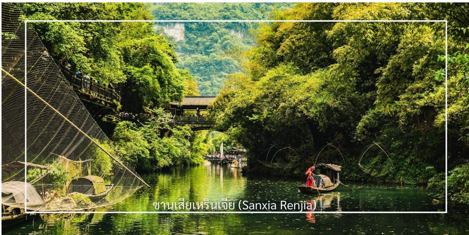
ซานเซียเหรินเจีย (Sanxia Renjia)

นำท่านสู่ หมู่บ้านซานเซียเหรินเจีย (Sanxia Renjia) (รวมล่องเรือ) สถานที่นี้เป็นที่รู้จักกันในชื่อ หมู่บ้านสามผา แหล่งท่องเที่ยวระดับ 5A ตั้งอยู่ในเขตหุบเขาสามผา ริมน้ำแยงซีเกียง โดดเด่นด้วยทัศนียภาพทางธรรมชาติอันงดงามของภูเขา หินผา สายน้ำ และหุบเขาที่โอบล้อมกันอย่างกลมกลืน สถานที่แห่งนี้สะท้อนวิถีชีวิตดั้งเดิมของชาวลุ่มแม่น้ำแยงซีเกียง ผ่านสถาปัตยกรรมพื้นบ้าน วัฒนธรรม ประเพณี ที่ยังคงเอกลักษณ์ไว้อย่างครบถ้วน พร้อมให้ท่านได้ชมการแสดงเรื่องราวเกี่ยวกับวิถีชีวิตควบคู่กับสายน้ำ