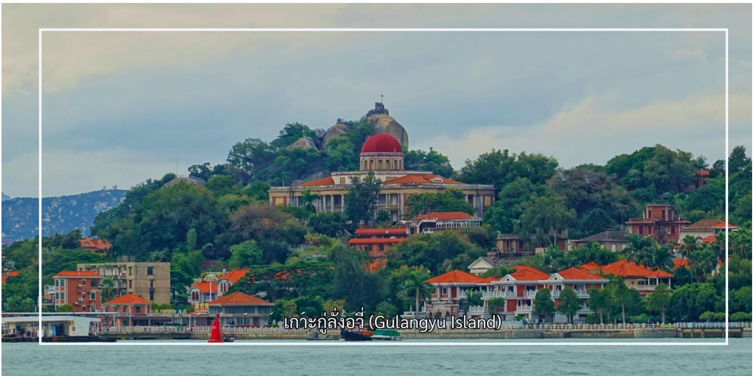
เกาะกู่ลิ่งอวี่ (Gulangyu Island)

สมควรแก่เวลานำท่านเดินทางกลับเซียะเหมิน นำท่านสู่ เกาะกู่ลิ่งอวี่ (Gulangyu Island) เกาะเล็กอันมีเสน่ห์ที่มีชื่อเสียงด้านสถาปัตยกรรมอันงดงามที่ผสมผสานระหว่างสไตล์ตะวันตกและจีน สะท้อนถึงประวัติศาสตร์การติดต่อกับชาติ