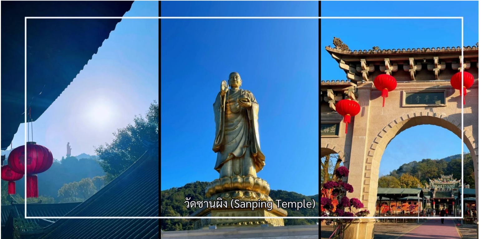
วัดซานผิง (Sanping Temple)

นำท่านสู่ วัดซานผิง (Sanping Temple) เมืองจิงโจว วัดพุทธที่มีความสำคัญทางประวัติศาสตร์และเป็นที่เคารพนับถืออย่างสูงของพุทธศาสนิกชน วัดแห่งนี้มีชื่อเสียงในฐานะศูนย์รวมแห่งศรัทธาและเป็นสถานที่ปฏิบัติธรรมที่สืบทอดมาอย่างยาวนาน วัดซานผิงโดดเด่นด้วยบรรยากาศอันสงบ ร่มรื่น รายล้อมด้วยธรรมชาติและสถาปัตยกรรมจีนดั้งเดิมอันงดงามผู้มาเยือนสามารถสักการะสิ่งศักดิ์สิทธิ์ เรียนรู้ประวัติความเป็นมาของวัด และสัมผัสถึงความสงบทางจิตใจ