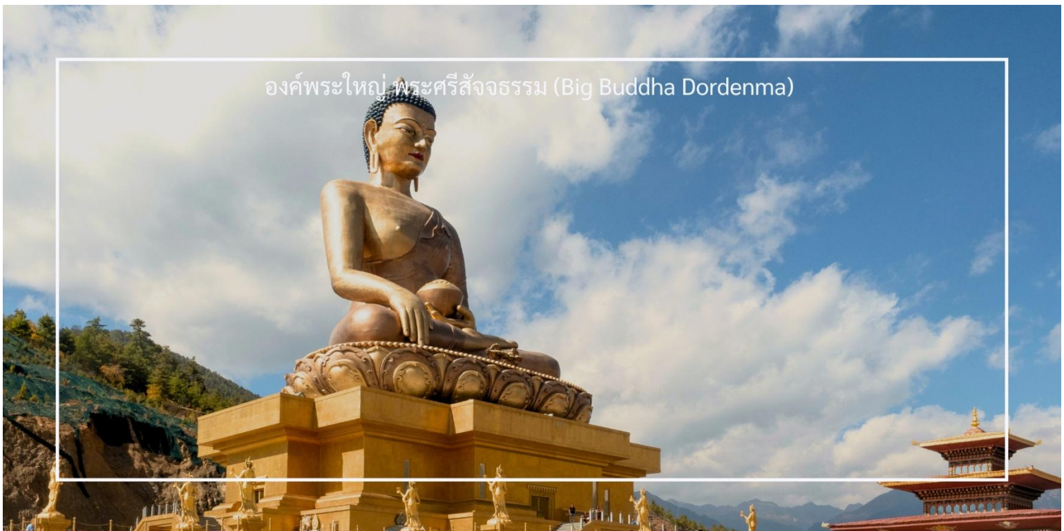
องค์พระใหญ่ พระศรีสัจธรรม (Big Buddha Dordenma)

เที่ยวชม องค์พระใหญ่ พระศรีสัจธรรม (Big Buddha Dordenma) เป็นพระพุทธรูปที่มีความสูงถึง 51 เมตร ตั้งอยู่บนยอดเขาในเมืองทิมพู (Thimphu) ประเทศภูฏาน พระพุทธรูปนี้เป็นหนึ่งในพระพุทธรูปที่ใหญ่ที่สุดในโลก