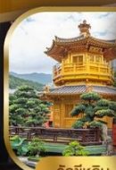
วัดชิลิน