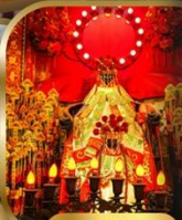
วัดเจ้าแม่กวนอิม ฮ่องซา