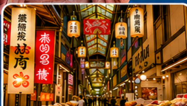
ตลาดปลานิชิกิ