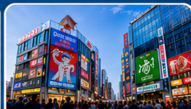
ช้อปปิ้งย่านชินไซบาชิ