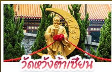
วัดเข่งต้าเซียน