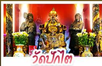
วัดปักโก๊ต