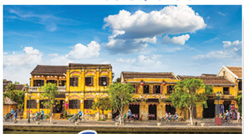
เมืองโบราณฮองอัน