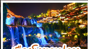
เมืองโบราณผู่เฉวง