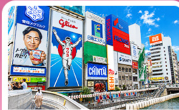
ชินโซบาชิจิ