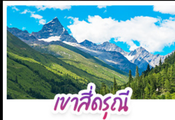
เขาสี่ครณี