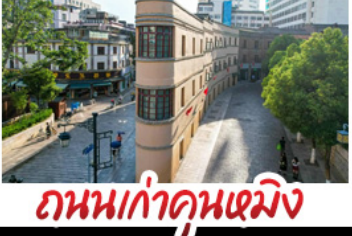
ถนนเก่าคุณเหมิง

27 ต.ค. - 01 พ.ย.69 ราคา 29,900 | 28 ต.ค. - 02 พ.ย.69 ราคา 29,900 | 29 ต.ค. - 03 พ.ย.69 ราคา 29,900 30 ต.ค. - 04 พ.ย.69 ราคา 29,900 | 31 ต.ค. - 05 พ.ย.69 ราคา 29,900