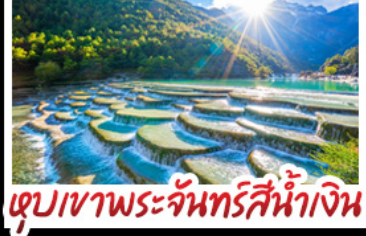
เขาสีฟ้าพระจันทร์สีน้ำเงิน