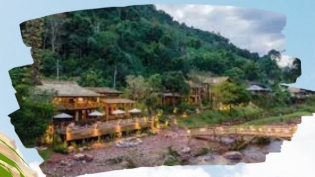
หมู่บ้านสะปัน