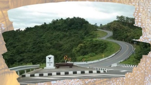
ถนนหมายเลข 3