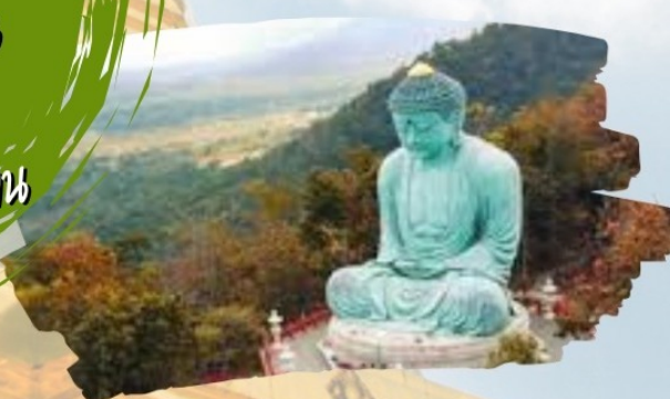
วัดพระธาตุดอยพระภาน