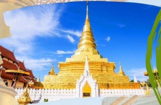
วัดพระธาตุแช่แห้ง