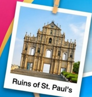
Ruins of St. Paul's