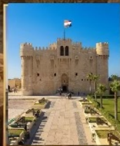
อเล็กซานเดีย