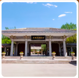
อุทยานประวัติศาสตร์จิวจวน

ไฮไลท์! เขตท่องเที่ยวเกี่ยวเกี่ยวจิงจางหม่า ชมทุ่งหญ้าและภูเขาสวยแห่งถ่านชู่ ภูเขาสายรุ้งจางเย่ต้นเสี่ย "มหัศจรรย์ภูเขาสายรุ้งหลากสี"