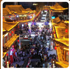
ตลาดจางเย่