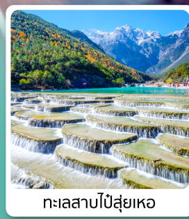
ทะเลสาบไป่สุ่ยเหอ