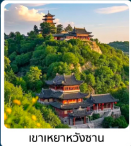
เขาเหย้าหวังชาน