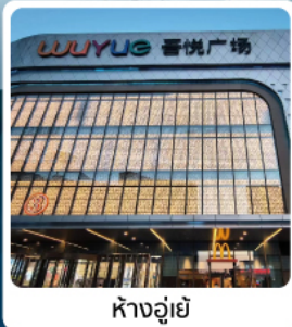
ห้างอู๋ยี่