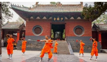
ชมโชว์กังฟูเล่าหลิน