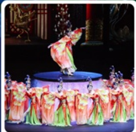
ไซส์ FOSHAN QIANGUQING