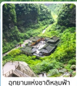
อุทยานแห่งชาติหลุมฟ้า

อาหารมื้อพิเศษ เปิดปิ้งกั๊ง, สุกี้หม่าล่า