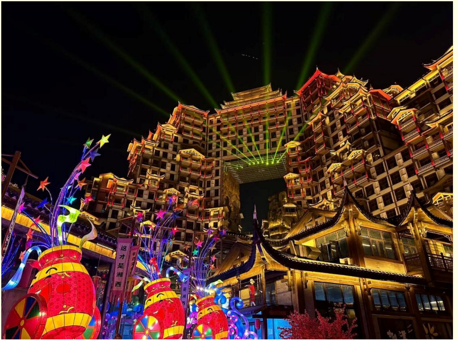
ที่พัก MELLOW CRYSTAL HOTEL โรงแรมระดับ 4 ดาว หรือเทียบเท่า