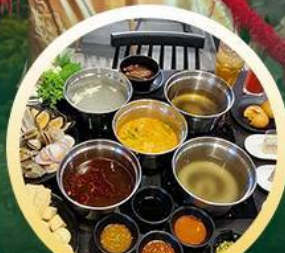
ซาบูฮ่องกง

02-04 มิ.ย. 18-20 มิ.ย. 07-09 มิ.ย. 20-22 มิ.ย. 13-15 มิ.ย. 25-27 มิ.ย. 14-16 มิ.ย. 28-30 มิ.ย.