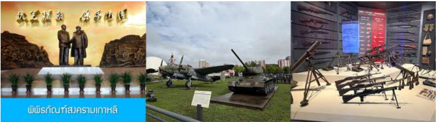
พิพิธภัณฑ์สงครามเกาหลี