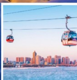
นั่งกระเช้าชมแม่น้ำซงฮวาเจียง