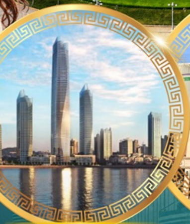
ชมวิวดาคารโซตัน เซ็นเตอร์