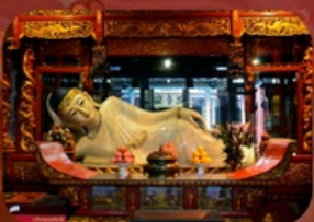
สักการะวัดพระหยกขาว