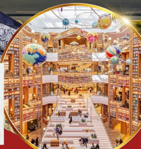
ห้องสมุด สตาร์พิลด์ ซูวอน

เชคอินห้องสมุดสุดอลังการ ชมศิลปะดิจิทัลสุดล้ำ บนจอ LED เสมือนจริงขนาดยักษ์ หมู่บ้านเกาหลีโบราณทุกซอก อันอก อิสระซ็อบบี้ง 2 ย่านดัง ซองซู เมียงดง ซ็อบบี้งปลอดภาษี Lotte Duty Free