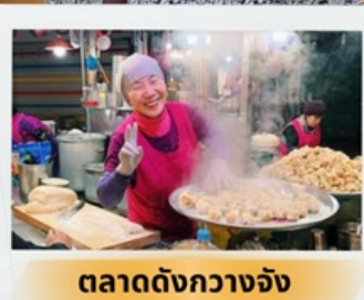
ตลาดดังกวางจ้ง