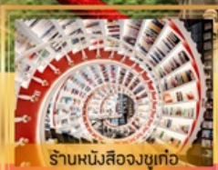
ร้านหนังสือจุก่อ