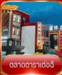
ตลาดตาราเตอวี