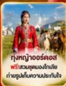
ทุ่งหญ้าออร์คอส ฟรี! สวมชุดมองโกเลีย ถ่ายรูปเก็บความประทับใจ