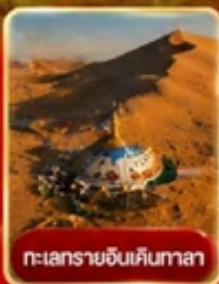
ทะเลทรายอินคินทาลา