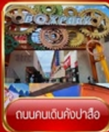
ถนนคนเดินคังปาสือ