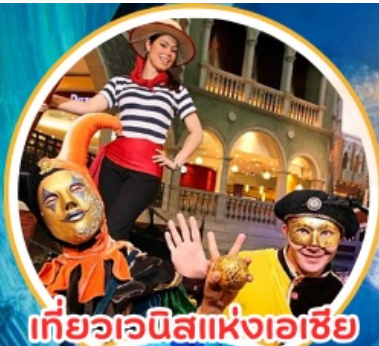
เทียวอณิสแห่งเอเชีย