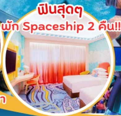
ฟินสุดๆ พัก Spaceship 2 คืน!!