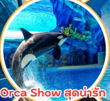
Orca Show สุดน่ารัก