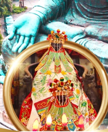
ยืมเงินเจ้าแม่กวนอิมสองฮา