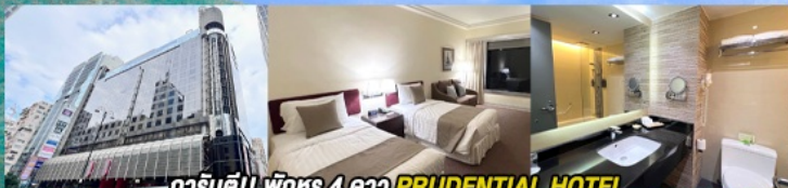
การ์ตูนดี!! พักหรู 4 ดาว PRUDENTIAL HOTEL ติดถนนนาธาน ย่านช้อปปิ้งจิมซาจуй