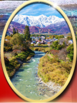
โออิเดะพาร์ค