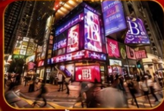
ช้อปปิงชิมชาซู๋

วัดเจ้าแม่กวนอิมฮ่องอ่า - ช้อปปิงชิมชาซู๋ - วัดนาจา วัดแขกหมิว - วัดหวังต้าเซียน