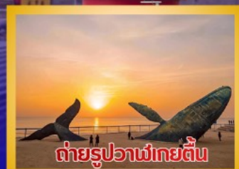
ต่ายรูปวาฬยักษ์ตื่น