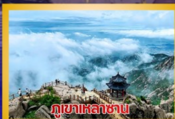
ภูเขาเหล้าซาน