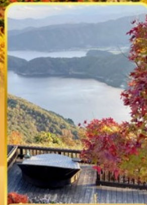
ชมยูบะกาตะ