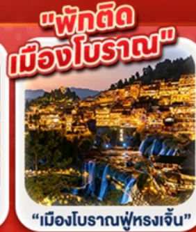
"เมืองโบราณฟู่หลงเจิ้น"