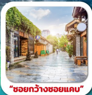
"ชอยกว้างชอยแคบ"