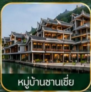
หมู่บ้านซานเซี่ย