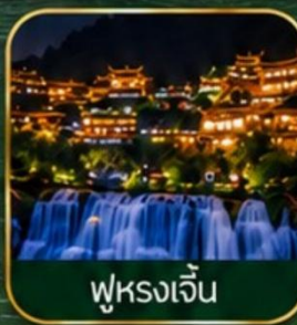
ฟูหรงเจิ้น