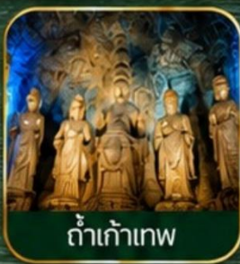
ต้าเท้าเทพ