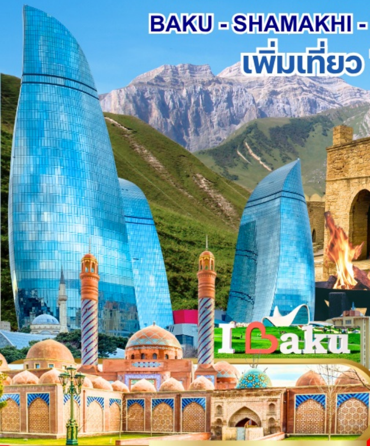
Masjed Imamzadeh Ibrahim