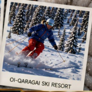
OI-QARAGAI SKI RESORT