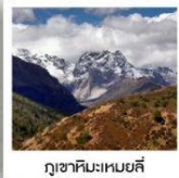
ภูเขาหิมะเหมย์ลี่

“เข้าอุทยานย่าตึง 2 รอบ” 43,999 FREE VISA