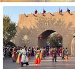
เมืองโบราณคัชการ์