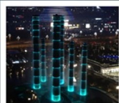
ห้างสรรพสินค้า SKP